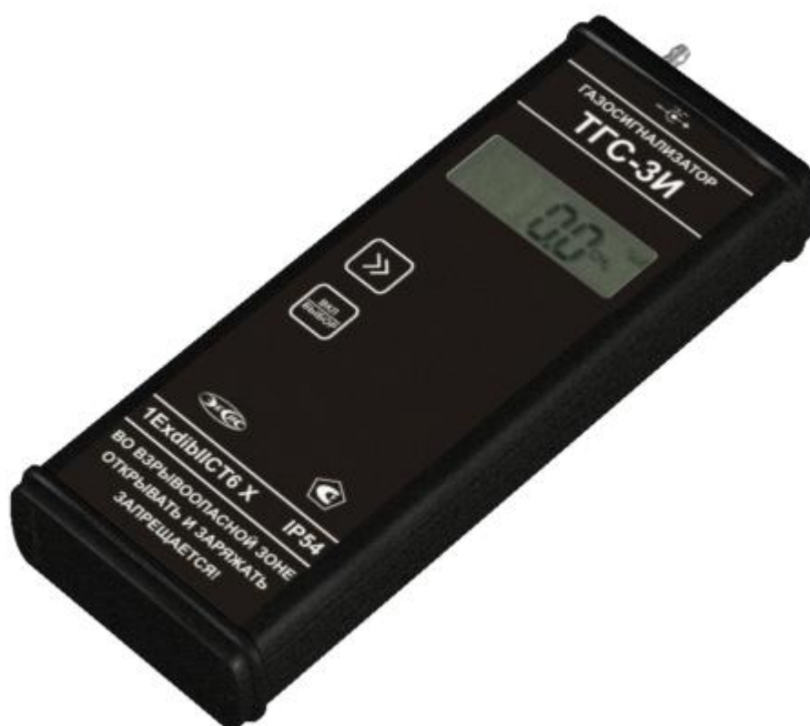
Рисунок 2 – Общий вид газосигнализатора TGS-3 И