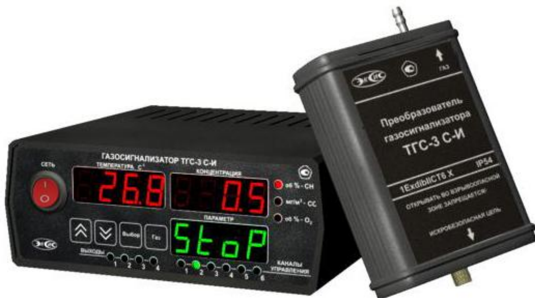
Рисунок 3 – Общий вид газосигнализатора ТГС-3 С-И