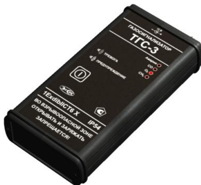
Рисунок 1 – Общий вид газосигнализатора TGS-3